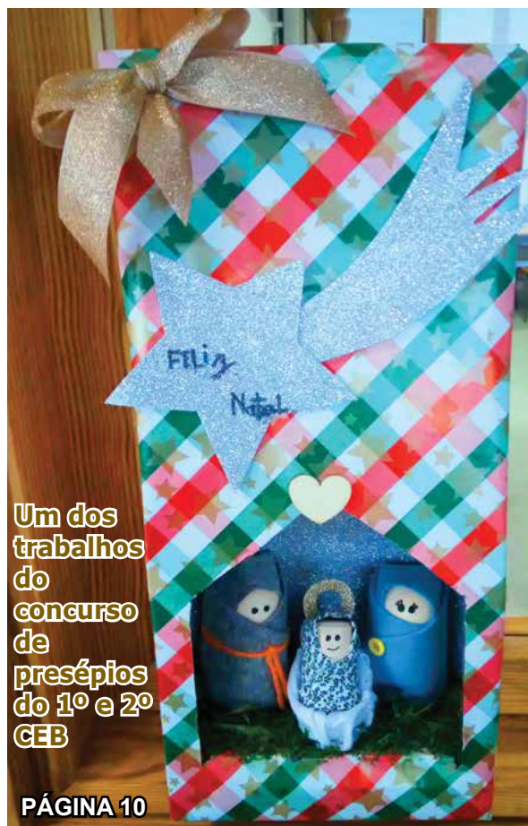
Um dos trabalhos do concurso de presépios do 1º e 2º CEB

JORNAL DO AGRUPAMENTO DE ESCOLAS DE PENALVA DO CASTELO