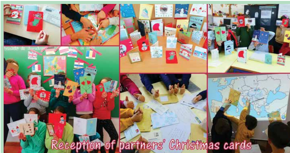
Reception of partners' Christmas cards