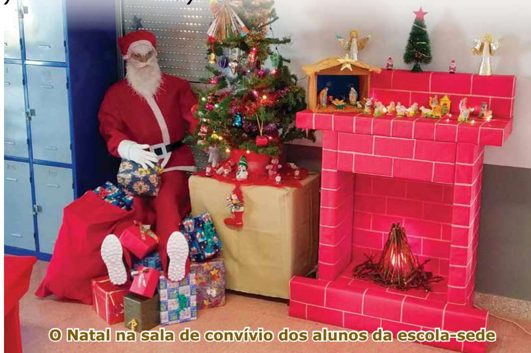
© Natal na sala de convívio dos alunos da escola-sede

Votos de um Feliz Natal e um Ano Novo pleno de sucessos, para toda a comunidade.