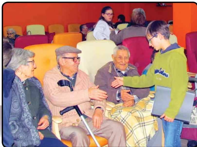
Alunos do 5.ªA